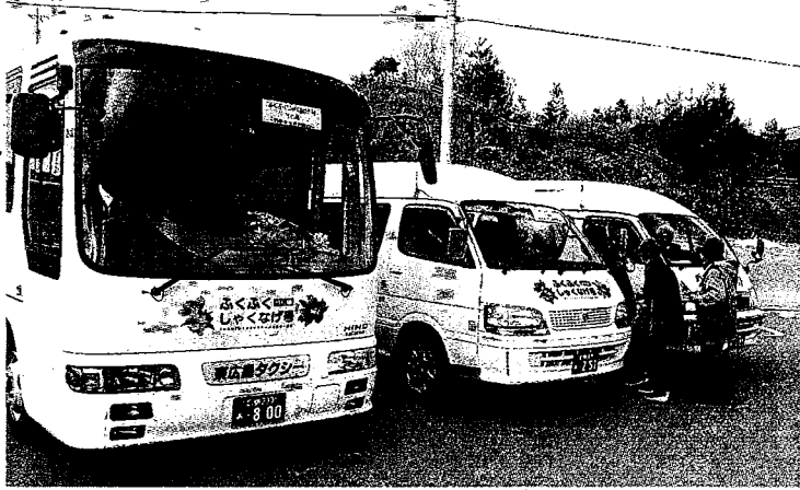
シャクナゲの花が目印の「ふくふくシャクなげ号」に乗り込む乗客

東広島市は一日、高齢者や車を持たない住民のため、福富町で公共交通機関「ふくふくシャクなげ号」の試験運行を始めた。ジャンボタクシーなど三台が町内を巡回する方式で早速、地元のお年寄りたちが利用した。市福富支所で出発式があり、お年寄りや児童ら約百人が出席。蔵田義雄市長が「公共交通の格差是正のため、福富町で始めることにした。便利に